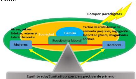
Figura 1. Equilibrio entre hombres y mujeres en las organizaciones, diversidad de ideas, creatividad, éxito.