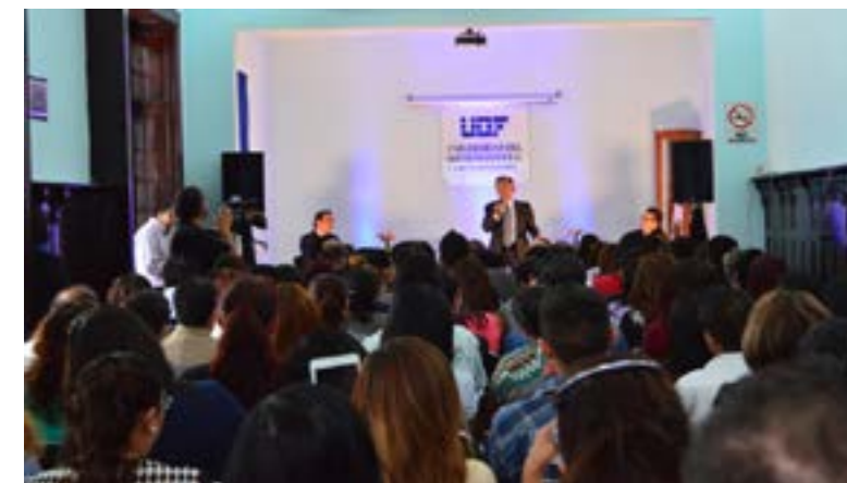
La conferencia magistral ofrecida en el auditorio de la UDF.