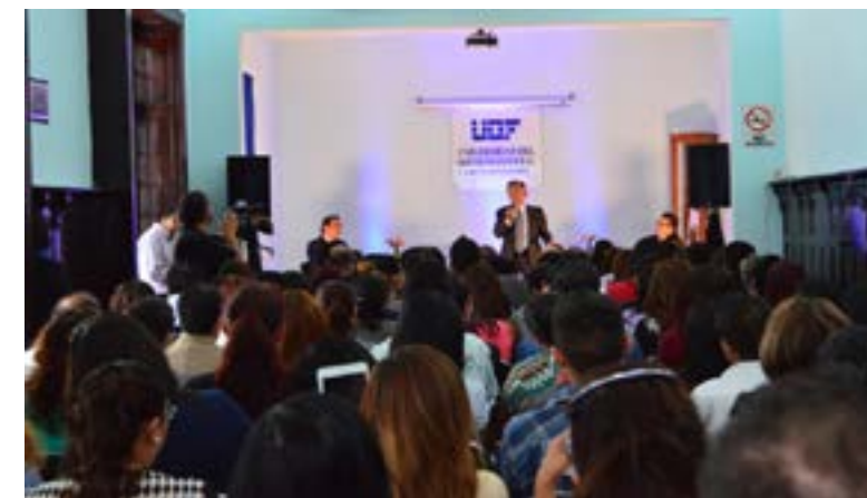
La conferencia magistral ofrecida en el auditorio de la UDF.