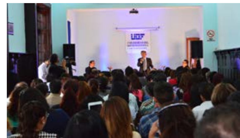
La conferencia magistral ofrecida en el auditorio de la UDF.